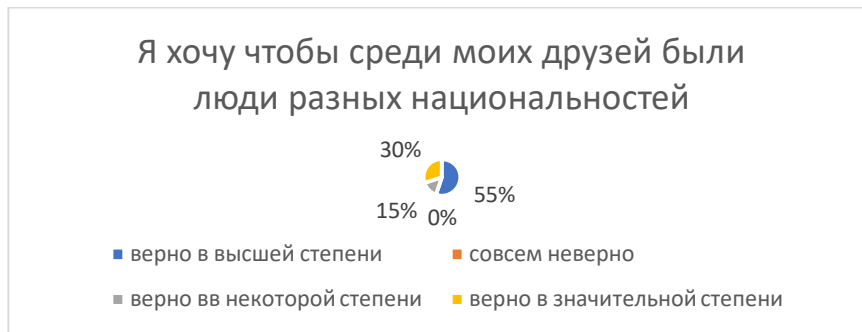
Рисунок 1. Предпочтение иметь друзей разных национальностей

По результатам ответов респондентов, на такие вопросы как: «Есть ли у Вас друзья, культура которых не схожа с Вашей?» На первый вопрос 85% (17) из всех опрошенных респондентов ответили «да» и только 15% (3) не имеют.