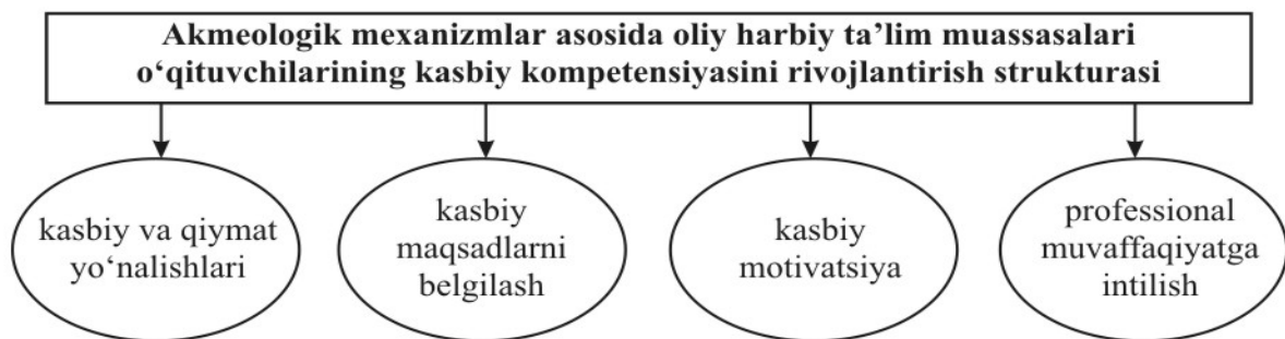
1-rasm. Akmeologik mexanizmlar asosida o'qituvchilarning kasbiy kompetensiyasini rivojlantirish strukturasi

Oliy harbiy ta'limni isloh qilishning muvaffaqiyati ko'p jihatdan kursantlarni o'qitish sifatini belgilovchi hal qiluvchi darajada ta'lim jarayonidagi asosiy shaxsning kasbiy kompetensiyasini rivojlantirish bilan bog'liq.